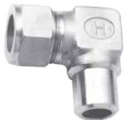
Вид метрической арматуры