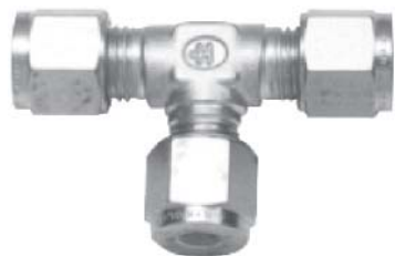
Вид метрической арматуры