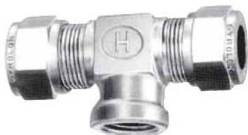
Вид дюймовой арматуры