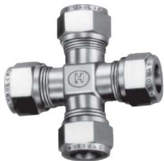
Вид дюймовой арматуры