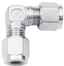
Вид дюймовой арматуры